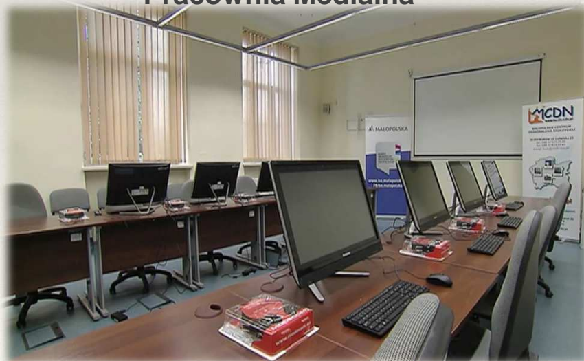
„Małopolska Międzypokoleniowa Pracownia Medialna”