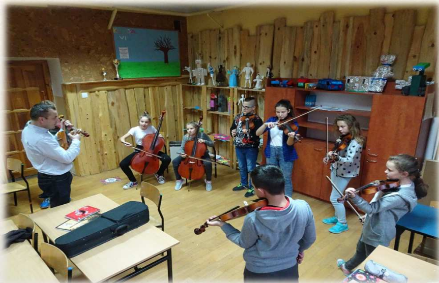
„Małopolska Międzypokoleniowa Pracownia Medialna”